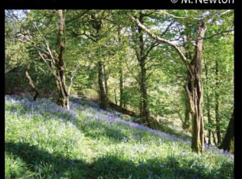
Bluebell Wood