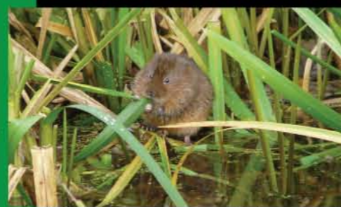
Water Vole