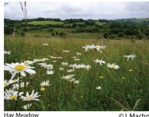
Hay Meadow

Mae Cynllun Gweithredu Bioamrywiaeth Lleol Sir Gaerfyrddin yn cael ei lunio gan bartneriaeth o gyrff sy'n ymwneud â gwarchod bywyd gwylt ein sir. The Carmarthenshire LBAP is being produced by a partnership of organisations concerned with the conservation of the county's wildlife.