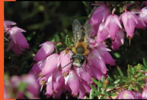
Honey Bee