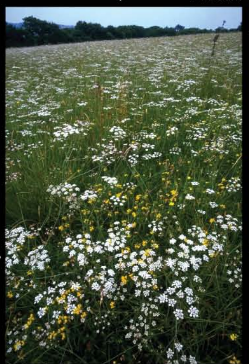
Carum Meadow © R. Pryce