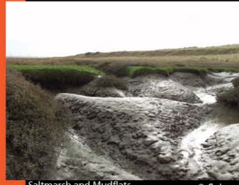
Saltmarsh and Mudflats