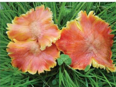
Waxcap Fungi