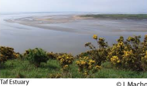
Taf Estuary

O ran y rhywogaethau sy'n destun cynlluniau gweithredu gennym, rydym am ehangu eu dosbarthiad a chynyddu eu niferoedd. Gallai hyn gynnwys cynnal arolygon i gael gwell dealltwriaeth o'u sefyllfa bresennol, gwella eu cynefinoedd a'r dolenni cyswllt rhwng y cynefinoedd hynny, a darparu manau iddynt gael lloches. For our action plan species we want to expand their range and increase their population size. This might include carrying out surveys to gain a better understanding of their current status, improving their habitats and the links between them and providing places of shelter.