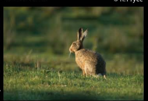
Brown Hare