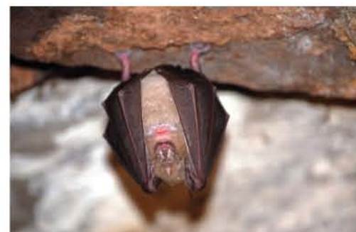
Greater Horseshoe Bat