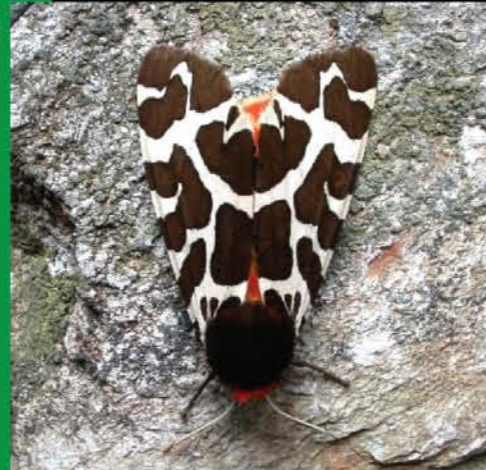
Garden Tiger Moth

www.carmarthenshirebiodiversity.co.uk www.carmarthenshire.gov.uk