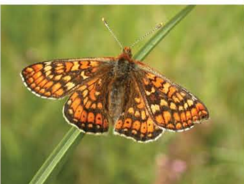
Marsh Fritillary