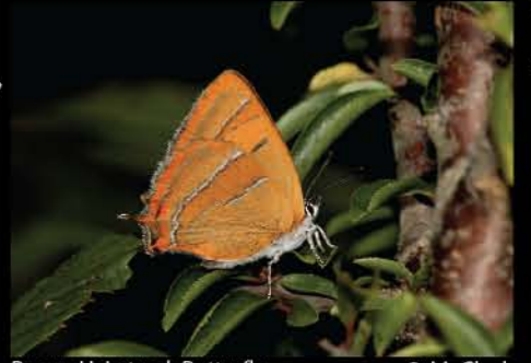
Brown Hairstreak Butterfly