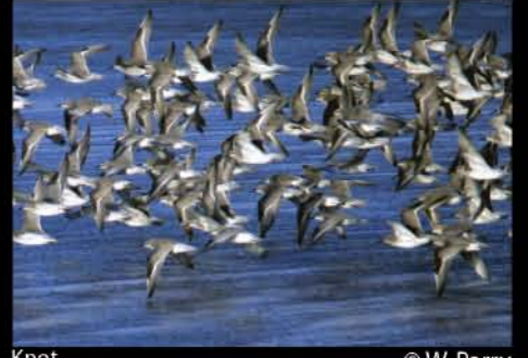
Knot © W. Parry

Carmarthenshire has a rich variety of biodiversity, from the rugged uplands and their steep oak woodlands in the north east of the county to the varied coastal habitats around Carmarthen Bay. Throughout the agricultural land and around the urban areas runs a network of wildlife habitats - hedgerows, woods, wet meadows and watercourses - all rich in species, which greatly influences the character of the landscape and its natural beauty. The biodiversity of the county contributes to the quality of life of the people who live and work in Carmarthenshire, and is a significant element in the local tourism and recreation industries.