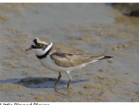
Little Ringed Plover