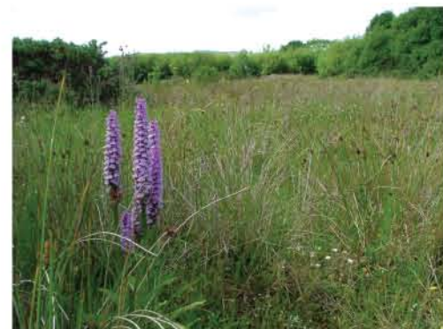
Brownfield Habitat